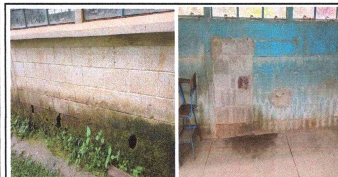
Foto 5: se nesecita darle mantenimieto a paredes de aulas que se encutran en mal estado,para mejor seguridad de nuestros alumoss