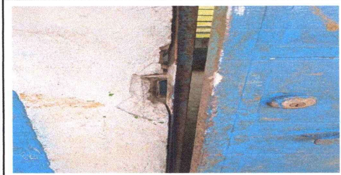
Foto1: Cambio de puerta de un aula