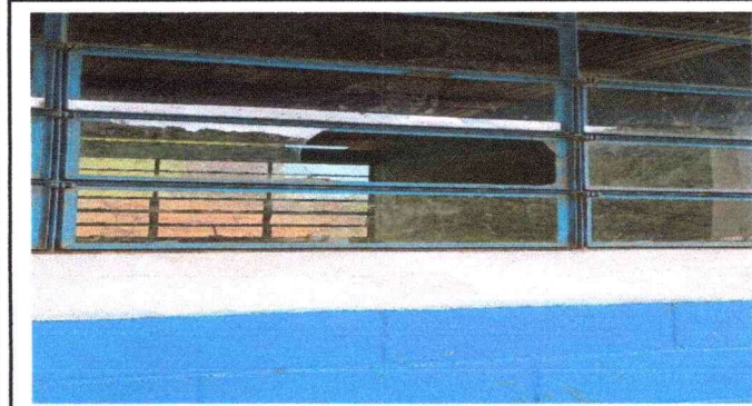
Foto 3: se solicita cambiar vidrios de varias aulas , que estan en mal estado