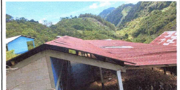
Foto2: cambio de cubierta de lamina en toda las instalaciones del centro educativo